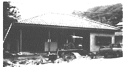
樋曾集落開 発センター

そのほかでは、訪問販売等に 多くみられる。「強引・強迫的 な販売」や必要以上に勧める「 過量販売」「体質の改善ができ る」「体調を崩しても「飲用を続 けることが大切」と指示され、 かえって症状が悪化したという 例もあります。 ケース③のほかにも、医薬品 に使われる成分が含まれ、薬事 法違反で摘発された「効く」