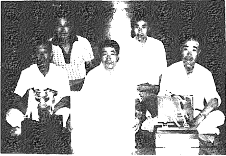
▲団体の部一位の米Aチームのみなさん