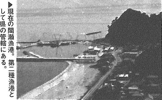
現在の間瀬漁港。第一種漁港として県の管轄にある。

昭和7年、弁天岩を基点に幅36m、長さ377mの防波堤築造工事が開始された。海岸から弁天岩まで棧橋にレールが敷かれ、石山から2トンの切り石(間瀬石)をトロッコで運び、海中に投げ入れが行われた。しかし、翌8年9月の大暴風雨で大破——計画は縮小された。戦後、農林省の所管で事業が再開され、22年、この弁天岩眼下の護岸工事がようやく完成、漁港整備の第一歩がはじまった。当時は人力による石運びが中心で、小石は背負ったり、かごに入れての作業であったという。