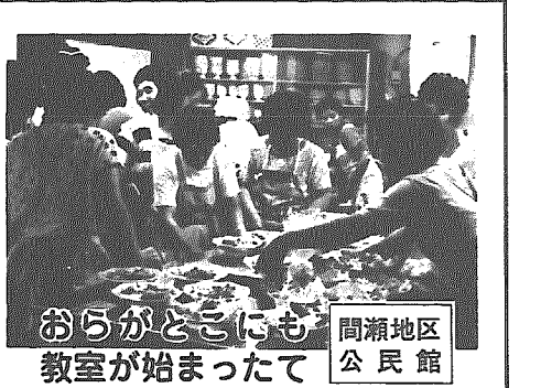
おらがところにも 間瀬地区公民館 教室が始まった

4月開館以来、地区のみなさんが待ち望んでいた、地区公民館主催の「教室」がこのほど開かれました。「おらがところにも、教室が始まったて…」と久しぶりに机に向かい、メモをとる姿に喜びがあふれていました。これから夏一 楽しい行事もいっぱいです。