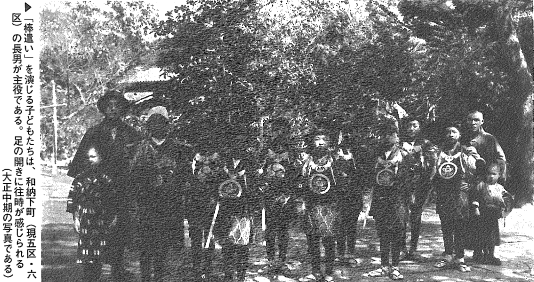
「棒遣い」を演じる子どもたちは、和納下町(現五区・六区)の長男が主役である。足の開きに往時が感じられる。(大正中期の写真である)

●応募先=〒953-01 岩室村大字西中860 岩室村役場 総務課 企画係 ☎82-4111 内線201・202