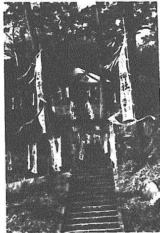
▲春風に大己貴神社の櫓はためく(間瀬)

四月は春祭りの季節「秋の祭り」と違い、にぎやかさはないが、家々でもよぎの草もちをつくり祝うことから「だんごまつり」といわれ、春が始まる…。