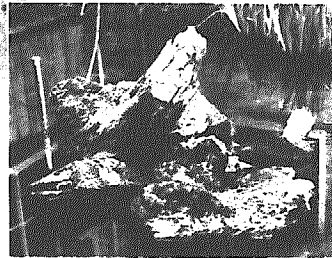
▲鯨の骨—昭和30年ころまでは、間瀬小学校校庭に骨格どおり保存されていたが、今では、校舎前の池の噴水脇にわずかに残された白い一片の骨を見るだけになった。

が、当時の和納駅(現いわむろ駅)まで背負って運んだ。解体後に残った骨は、標本として間小グラウンド脇に30年ころまで保存されていたが、その後一つ二つとなくなり、漂着から半世紀が経った今では、校舎前の池に一片だけがその姿をとどめているだけである…。