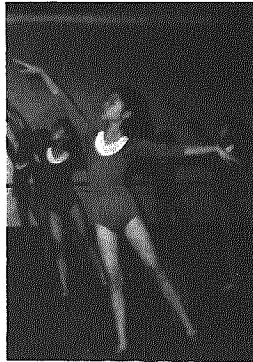
▲将来の中国を担う—上海市静安区の少年宮バレエ学習。英才教育の一環として幼い時からみっちり仕込まれる。

隊(小学校二年生以上全員)がありました。学校が終わると課外活動の場として少年宮があり専門分野の教育をしているのですが、この子らは就職する時には国の指示に従わなければならないとのことでした。 子どもたちに、「大きくなったらどんな人になりたいか」の質問に、「祖国のためになる人とみんな同じ返事がきた。エリート教育はすばらしいが、子どもたちの自由はあるのだろうか」と考えさせられました。 最後に訪中での体験やこれを通して良き友を得たことは、これからの私の人生の原動力にしたいと思えます。