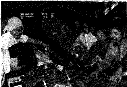
▶ 昨年の農業祭から