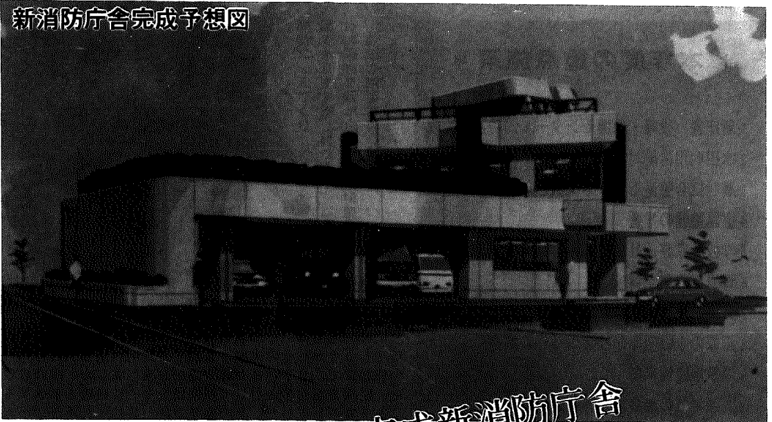
新消防庁舎完成予想図