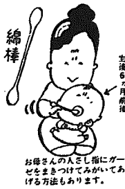
生後6ヶ月前後、お母さんのお乳を飲むときに歯にグーゼをまみつけてみてあげると、磨ける方法もあります。