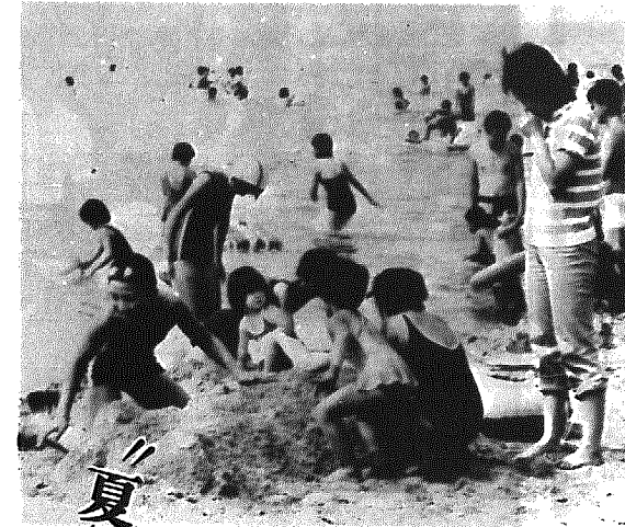
夏は海辺の風景 SUMMER BEACH

(2)母親の部及び一般の部 ●四百字詰原稿用紙五枚以内 ●応募区分・住所、氏名、職業などを記載する。 〒100 東京都千代田区永田町一―六―一 総理府交通安全対策室交通安全作文募集係 詳しくは、県交通安全対策課(☎〇三三〇五五一一)または役場総務課企画係まで。