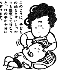
この子に乳歯の発達を促すには、しっかりと噛ませることが大切です。

乳歯はどうせはえ代わる歯だからといって、痛みさえなければ、放って置くという人が多いのではないのでしょうか。 乳歯が子どもの発育にとって大切な役割を果たしていることを知っていますか。 ①栄養をとるための大事な器官 乳歯も歯ですから、食べ物をかみ切ったり、かみくだくのももとも大切な役目です。かみくだぎながら、唾液と混ぜ合わせて最初の消化を行います。それによって胃や腸での消化がより効果的に行われ、栄養素の吸収が十分にできるようになるのです。