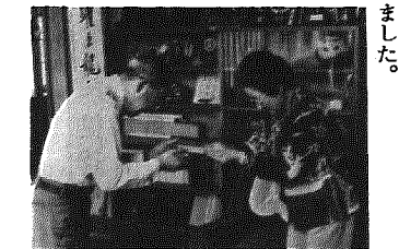
▲岩室村婦人会が善意の寄付

七月は所得税の予定納税第一期分の納税をする月です。納税額は、その人の前年の所得税額のもの額です。なお、予定納税基準額が一〇万円より少ない人は、予定納税をする必要はありません。