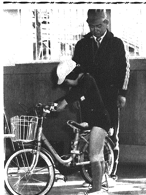
▲ 乗るまえには必ず点検を……