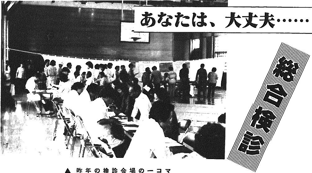
▲ 昨年の検診会場の一コマ