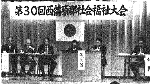
第30回西蒲原郡社会福祉大会

進行する高令化社会にとともに、福祉のあり方が問題になっている今日、単に福祉向上のための諸施策の要求だけでなく自らも参加する福祉のあり方を考えようと、この程、公民館を会場に第三十回西蒲原郡社会福祉大会が開かれました。 青少年の健全育成、老人福祉、児童福祉など六つの分科会で福祉とは何かについて、真剣に話し合い、最後に郡民総参加によって、それぞれ町ぐるみ、村ぐるみで福祉の展開に努力しようという大会宣言をして終了しました。 一人ひとりが福祉についてもっとまじめに考えることが大切ですね——とはある参加者の声でした。