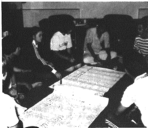
▲活動計画を話し合うクラブ員

六月に行われた青年講座がキッカケになって、村の青年たちがレクリエーションクラブを発足させました。子ども会活動や、社会教育活動でレクリエーションとしてゲームや軽スポーツを取り入れることにより、霧雨気づくりに役立つなど知っておくと便利です。こんないろいろな技術ややり方をみんなで勉強し合おうと、クラブでは、毎月二回、第二、第四の水曜日、公民館に集って活動しています。 もんですから会員もそう多くなく気軽にそのつど相談し合ってやっています。よ、楽しんでですね、もっとこの輪を大きくしたいんです。とある会員は話しています。 ちなみにこの会の目的は「レクリエーション活動を通じて、青年としての知識を身につけ、相互理解を深め、仲間づくりをめざす」となっています。 あなたも仲間に入ってみませんか。 意欲のある方、公民館（TEL二一四四四）へ