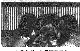
▲盛会だった民謡発表会