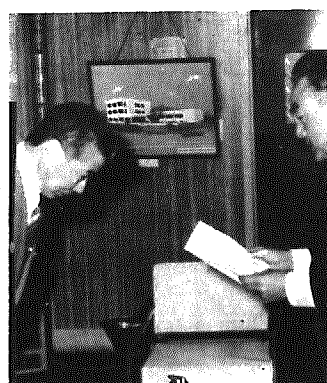
目録を受ける助役

東北電力より 防犯灯二十七基 東北電力より、防犯のために役立ててほしいと、防犯灯二十七基の寄贈がありました。村では、その趣旨に添って、関係者と協議し、設置することにしています。 ありがとうございます。