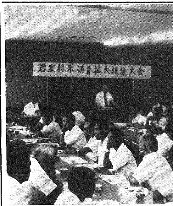
▲ 米の消費拡大推進大会でも米飯給食導入の要望があった...

「学校給食に米飯をとり入れてはどうか」という意見が所々方々で聞かれるようになったのは昭和四十年頃からで、いわゆる米の需給が著しくそのバランスをくずし始めた頃からです。即ち米の生産量が消費量を大きく上まわり年々増加する余剰米が国の農業政策の上で大きく問題視されるに至り、米の需要拡大の必要性が強く称えられ、その一環として学校給食に米飯をとり入れる要求が次第に高まってきたわけですから、勿論、これまで学校給食に米飯を使用することを全く禁じられていたわけではなく、完全給食における米の使用については、農山村漁村において、地理的、経済的、または又季節的な理由により、学校給食へ米飯を導入するに必要十分な条件がそろっている学校は、米の利用が認められていました。 文部省でも、全く教育的立場から保健体育審議会を中心に、昭和四十五年から五ヶ年計画で米飯給食実験校を指定し、米飯導入にまつる諸問題に対して、慎重に検討を加えてきたところですが、昭和五十年十二月、学校給食分科審議会より、学校給食へ米飯を導入することは極めて有意義であるとして、米飯導入の経過を概略申し述べましたが、それはあくまでも従来の学校給食の内容を全面的に米飯に置きかえるというのではなく、従来のものに更に米飯をとり入れることにより、より一層食生活内容を豊かにし、学校給食の本来の目標を達成することを期すという専ら教育的見地に立つた措置です。