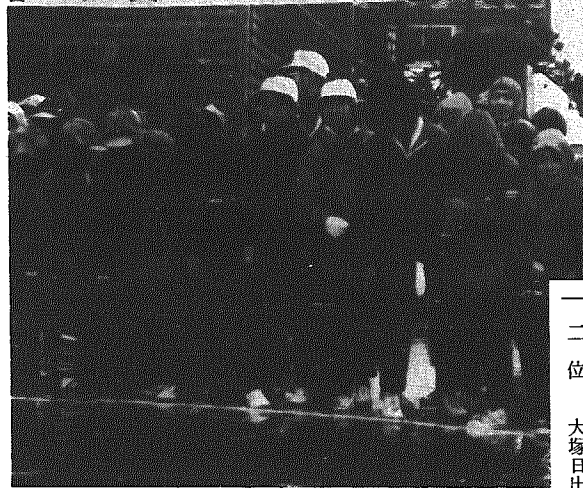
あいにくの雨のなか元気にスタート