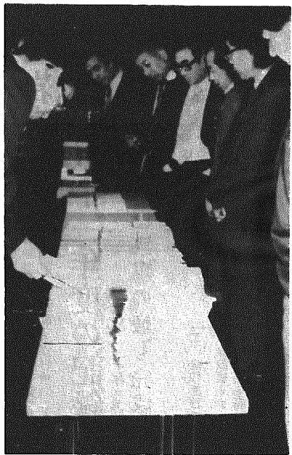
▲このなかから「寄りなれ岩室」の発想が――