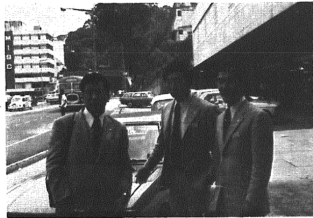
マレーシアの日本大使館前で仲間と

せぬに為にも、日本商社は目先の利よりも将来の東南アジアの進むべき道を示唆するような働きをせよという声もある。 また、商社マンの他に海外でアジア地域で数百年の歴史がある人達がいる。そして、彼らが先きに動き回り、彼らに教えてもらった行動が彼らの心に通じ、絶大な信用を受け赴任期間が過ぎても、もっと長く残ってほしいと望まれる人も多く聞いた。 しかし一部の日本人からでもこんな喜びが溢れている事業にも問題があった。協力隊にはなく援助協力隊全体である。経済的、技術的