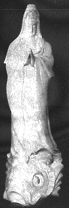
深緑と純白の観音像