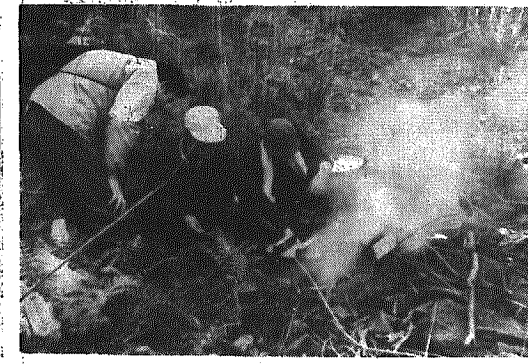
(タラ汁はまだかな)

「体を鍛えよう」実践の一環として去る5月2日、体育協会、親和会、公民館共催により村民楽しく歩く会を実施した。 天候に恵まれ家族づれ参加が目立ち、白岩、銅山跡、岩松、サキキツの变化に富んだ海岸コースを歩き越後七浦観音建立予定地の銅山跡での昼食には、手づくりのタラ汁を楽しみ、間瀬銅山の歴史と観音像建立の趣旨を村長より説明を受け有意義な一日をすごした。