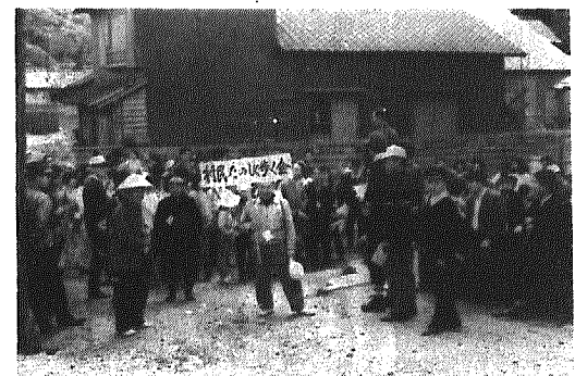
(体協会長のあいさつ)