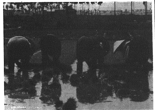
さわやかな空と風に反して、苗をとる手つきも、何にかさえない

田植も終りホットしたこのころ、心配された天候も初夏の風さわやかな日が続いた。これから米を中心に生きる農家の心配は多くなりそうだ。米の登録をめぐる、農協と農家のツメタイ反目。――自主流通米と食管法改正の動き、政府の米価据え置き政策――米の上にアグラをかいていた農家のところへ荒波がおしよせてきた？