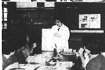
写真上から 診療に訪れる人……問瀬市をなす？ 背の高さ計るなんて学校卒業以来だワ！ 血液の比重検査 坊や探血後そつとナミダふいていた 栄養の正しい普及は調理実習を通じて……指導