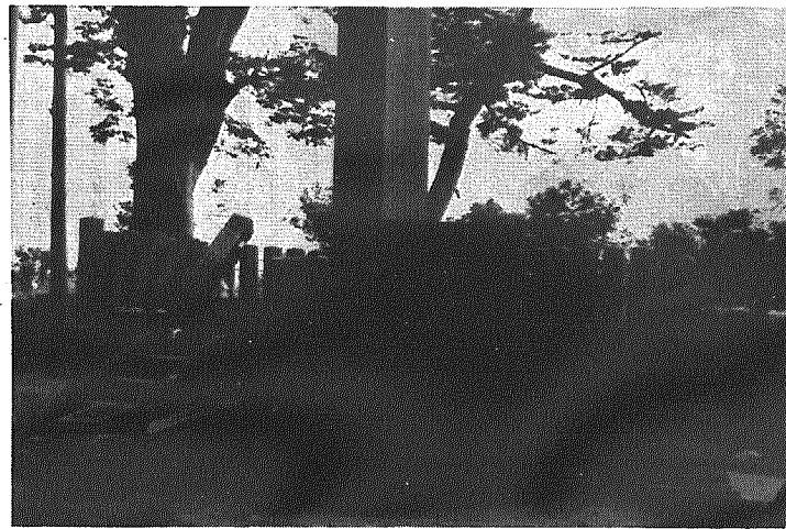
安らかに眠った魂をもゆり動かして倒れ落ちた思魂碑の玉垣と石燈籠(上)二階が落ち居住不能になった家屋(左)