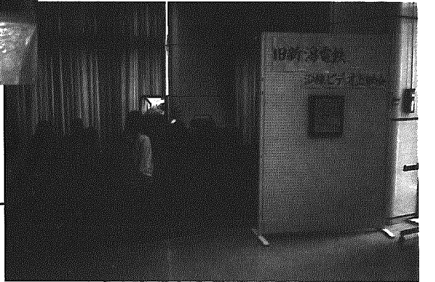
また、両日には、旧新潟電鉄沿線ビデオ上映会も開催されました。

3月3日・4日 北部地区公民館主催の「公民館へ行こう! (3月4日~26日)」の第一弾として、陽春花物・山野草展示会が同公民館で開催されました。会場には、ボケ、カンバイ、ツバキなどの陽春を代表する花物や、ユキワリソウ、フクジュソウ、バイカオレなどの山野草が展示され、来場者は一足早い春を満喫していました。