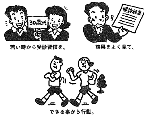
若い時から受診習慣を。 結果をよく見て。 できる事から行動。

健診は、病気の早期発見以外に、体の変調が自覚症状で現れる前に、目で見れる検査データ等で、体が出している黄色信号に気づけるもの。そのシグナルを前向きに受け止める事が大切です。「前から、糖尿病の疑いがあるって言われてたけど去年とあんまり変わらないから」、「コレステロール高いけど自覚症状がないから」等という気持ちは、ありませんか。黄色信号を無視すると、思わぬ事に... 先ず、自分の体をもっともっと知りましょう。