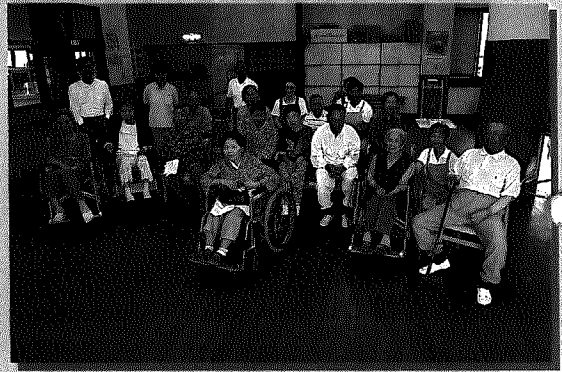
デイサービスを利用している皆さん