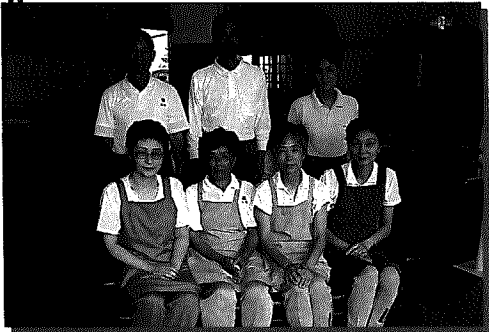
デイサービスのスタッフの皆さん

自分で入浴できない方や、 自分で日中一人でいることが 多い方はぜひ利用してくださ い。デイサービスに来て、人と 話をする中で心の交流にも なるし、介護する人のリフ レッシュにもなります。周りの 人はデイサービスに来ること を暖かく見守って欲しいと 思います。来られた方が、一 日おだやかに過ごせるよう に、人格を傷けないように注 意しています。現在約80人の 方が登録しています。週1回か ら月3回、送迎、入浴、食事 付きで一日過ごします。