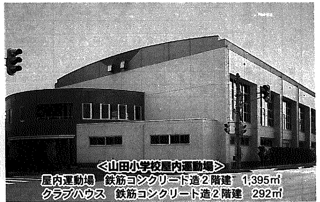
〈山田小学校屋内運動場〉

所在地 小平方、埋立地面積 5,200㎡ 埋立容量 19,500㎡、処理能力 37㎡/日