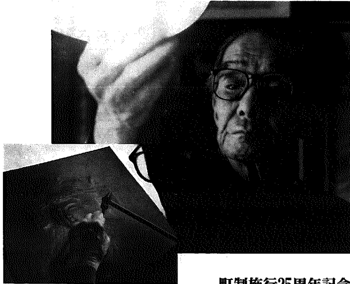
町制施行25周年記念