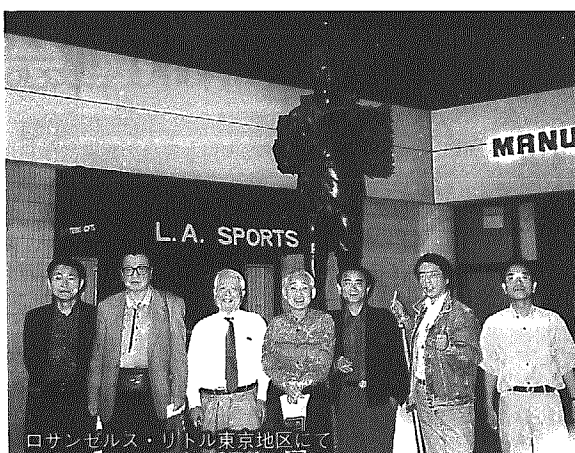
ロサンゼルス・リトル東京地区にて

その分担当があつて成立し、仕事全体の重要さから理解して大事にすることだ。企業の発展は、人が何を考え何を求めるかそのニーズを的確に掴むことにある。これらは、地域社会や会社のコミュニケーションから具体的に掴みとり、ネットワークで確実な知識と協力を得ることが、適切な創造性につながるものと思つている。必要が仲間と力を合わせ、特性や技術を補いあつて新分野にも発展を目指すこともできるのではなからうか。 ボランティアの精神即ち共存共栄の地域造りであり、言葉を掛け合う温かい町づくりにつながるものと思われ。