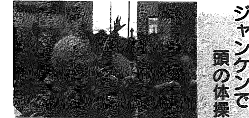
ジャンケンで 頭の体操

11月28日(金)、町長就任後、初めての町政懇談会がスタートしました。これは、「町民の皆様はわかりやすく開かれた行政」をめざすため、広く町民の皆さんと意見交換をしようとして開催されたものです。黒島公民館を皮切りに、小学校区単位に町内7ヶ所、12月5日(金)まで順次開かれました。どの会場でも一番の関心事は新潟市との合併問題で、「新開での情報しかなく、見通しがわからない」、「建設計画の内容はなごの質問に、町長は、「新潟市へ建設計画案を提出したが、まだ戻ってきていない。財政の裏付けがない内容はお話しできないが住民本位の合併をめざす」と述べ、理解を求めました。「特設建設」、「舟券売場問題」などについて質問がありました。