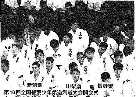
第10回全国警察少年柔道剣道大会開会式

7月26日(土)に行われた第10回新潟県警察柔道剣道大会で、新潟西警察署代表の黒崎町柔道連盟が強豪を打破し、2年連続で優勝を果たし、全国大会に出場しました。