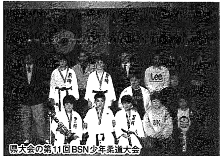
県大会の第11回BSN少年柔道大会

黒埼町の柔道選手は最近、素晴らしい成績をあげています。先ず4月6日(日)、新潟市鳥屋野総合体育館で行われた全国少年柔道大会県大会で、黒埼町柔道連盟が白根柔道教室を代表戦で下し、2年連続で優勝を決めました。