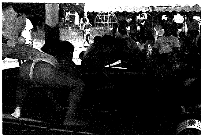
近郷少年相撲大会