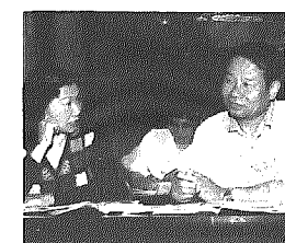
平成9年度前期(4～9月)英会話教室を開講します。