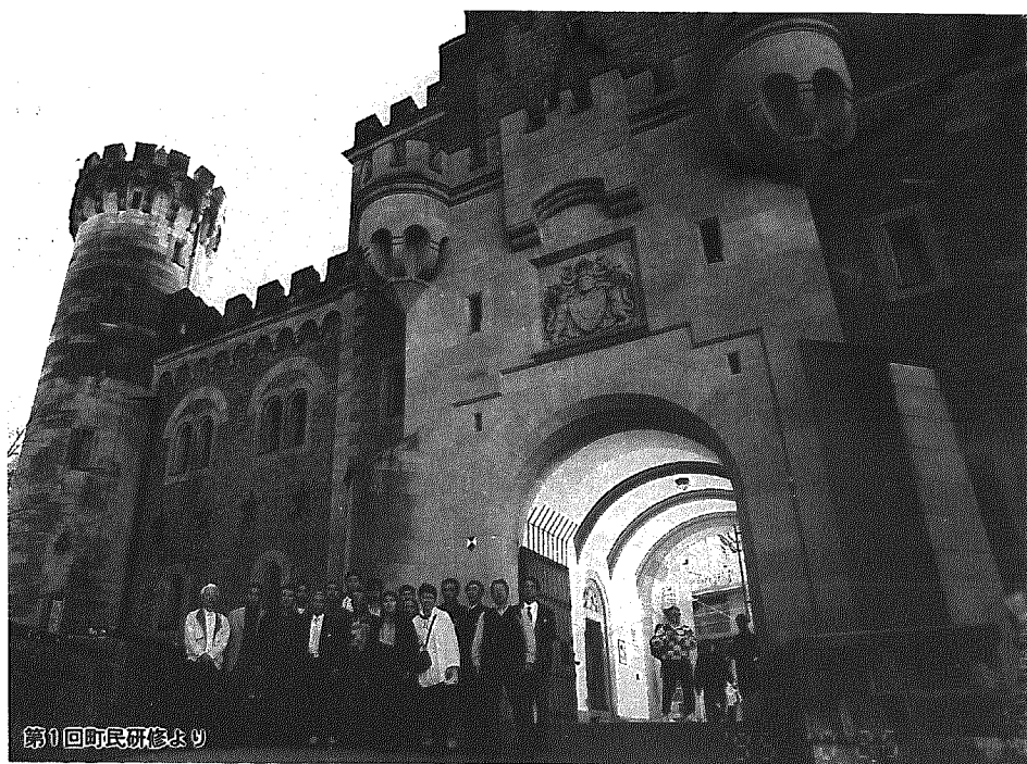
第1回町民研修より

これからのまちづくりには、町民の皆さんの参加を得て、行政各分野における施策を固めていくことが必要です。そのため町では、昨年引き続き国際的視野に立った「まちづくり」を担う人材を育成すべく、町民海外研修を実施し、参加者に費用の一部を助成します。まちづくりに意欲のある方は奮って応募ください。