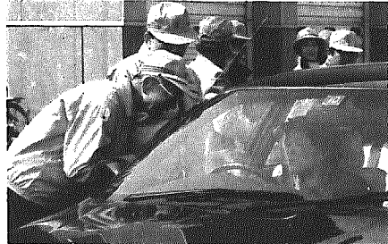
「気を付けてください」