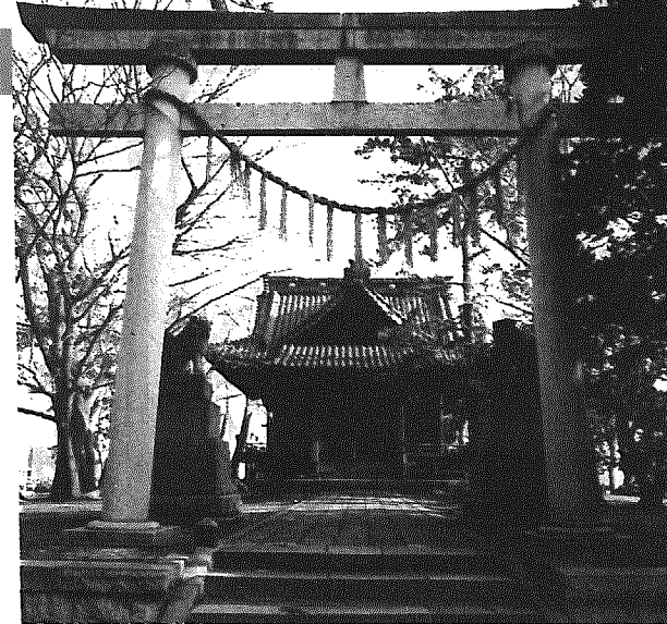
緒立八幡宮——黒鳥兵衛にまつわるさまざまな伝説が残されている

黒埼町史は『資料編3近代』『資料編4現代』『資料編5自然』の3冊がすでに刊行されています。 『資料編3近代』は明治維新から昭和20年の敗戦までの、黒埼の政治・経済などの資料を収録。897ページで1冊5千円(消費税込み。以下の価格も同じ)。 『資料編4現代』は昭和戦後の黒埼村・町に関する資料を収録。565ページで1冊4千円。 『資料編5自然』は町内の動植物や気象・地質などをオールカラーで紹介。386ページで1冊1万円。 参考資料の『新発田藩主溝口家御記録「歴代廟記」抄』も頒布しています。江戸時代の黒埼町城の多くを統治していた新発田藩の公的年度記録を収録。並装・428ページで1冊3千円。以上4冊とも役場新館2階の町史編さん室で取り扱っています。 ☎025-377-3832 内線231、233