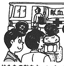
はたちの献血キャンペーン(1月6日～2月5日)