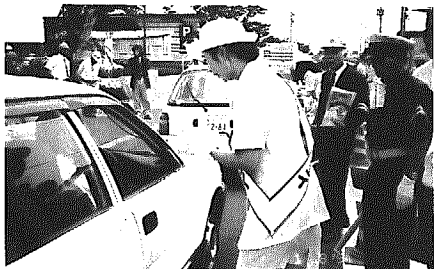
街頭指導所の様子