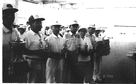
優勝トロフィーを手にした