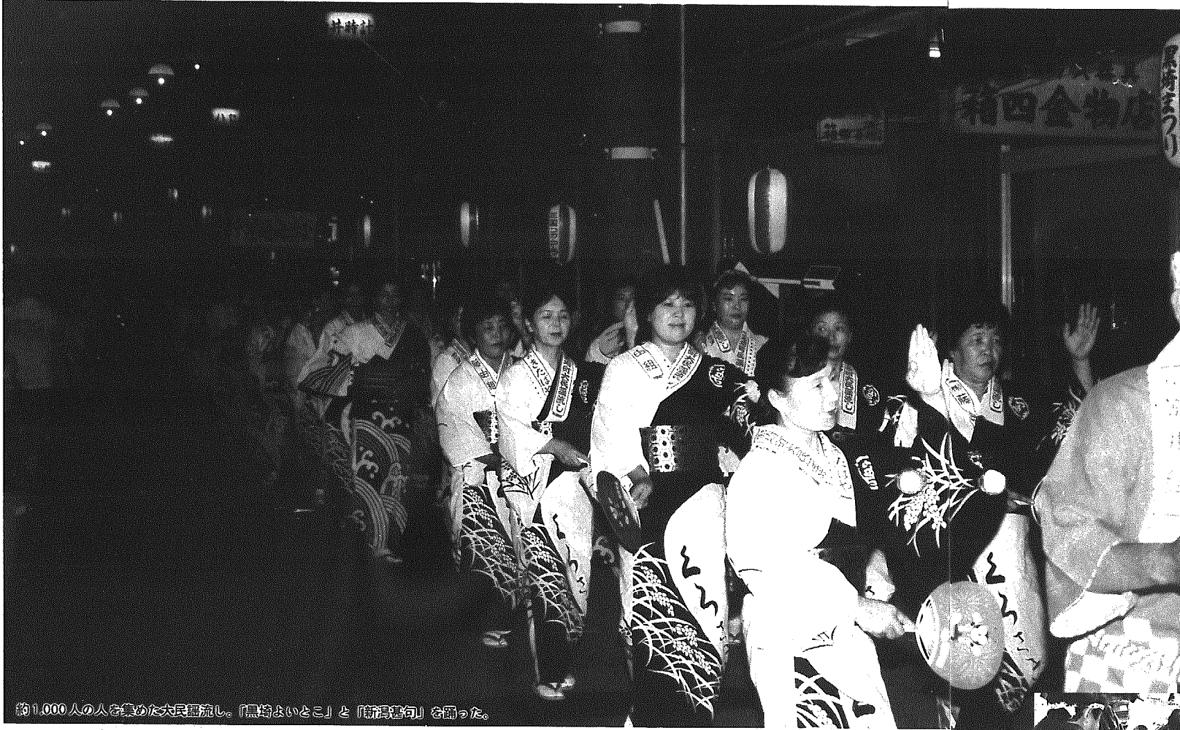
約1,000人の人を集めた大民謡流し。「黒埼よいとこ」と「新潟若句」を踊った。