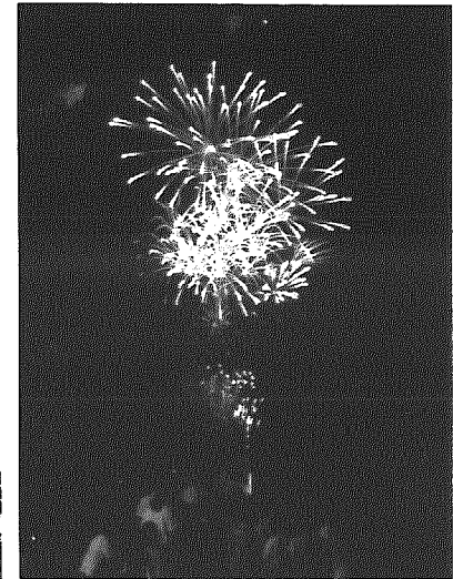
今年の花火大会は、山田河川敷公園を観覧会場にして行われました。210発の花火が夜空に打ち上げられました。

17日は町芸能保存会の皆さんによるふれ太鼓でまつりの始まりを知らせ、午後からは大野町商店街で親子ふれあい広場、夕方から大民謡流しが行われました。また、18日のおまつり広場、花火大会は新潟ふるさと村での開催とあってか、多くの人が集まりました。