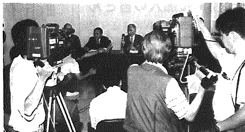
意見書提出後、記者会見が行われる

町長から新潟市との合併問題及び当町のまちづくりの基本的事項について意見を求められていた黒崎町合併問題懇談会は、七月十三日までに意見書を取りまとめ、同日町長に手渡しました。この意見書は、序文、総論、各論の順にまとめられていて、序文では「当懇談会の意見を尊重すると共に予定されている住民説明会などで広く町民の声も聞いて取り組むよう」要望しています。(意見書の詳細は八月十五日号でお知らせします。)