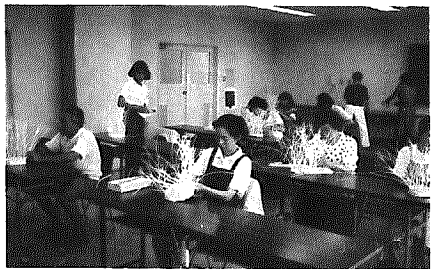
箏手芸教室のようす