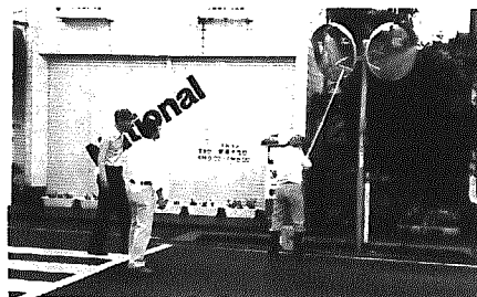
交通安全のためミラーをみがく