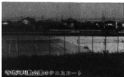
寺地河川敷公園のテニスコート

E議員 町内スポーツ施設の利用率と利用人数について ①サッカー ②テニス ③ゲートボール ④野球 ⑤トラック競技 ⑥その他 ⑦サッカーは今後利用率が増すのではないかと、現在の施設(多目的広場)で充分だと考へるか。また指導員について人数なども充実出来るか ⑧指導者の充実、指導実施日数の増加、施設の充実(ゴールポストを1基増設)についてご答弁を ④木場野球場協のテニスコートは使用不能だが、代替地の用意はどうか。また、寺地河川敷公園テニスコート