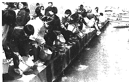
サケよ、大きくなって帰ってこい