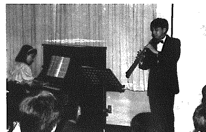
オーボエとピアノの夕べ