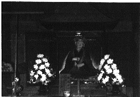
万元上人坐像(分水町・国上寺阿弥陀堂)