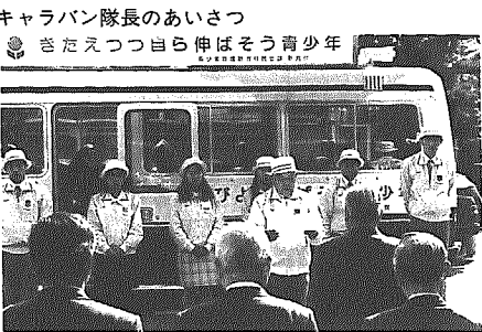
キャラバン隊長のあいさつ

キャラバン隊が来庁 十一月九日(火)、青少年健全育成巡回キャラバン隊が本町を訪問。これは11月が青少年健全育成強調月間のため、新潟県がその運動行事の一環として行ったものです。当日は町長はじめ青少年育成町民会議の関係者が迎えるなか、役場に来庁し、キャラバン隊から町長に総務庁長官のメッセージが手渡されました。