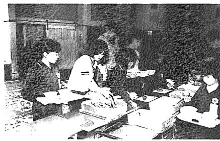
このおかず、おいしそう。