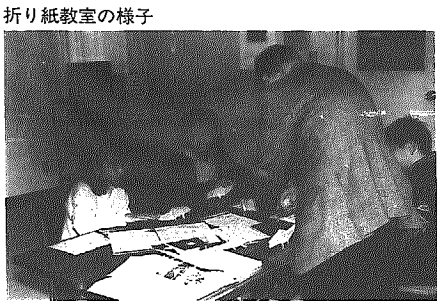
折り紙教室の様子

折り紙で恐竜を折る 十一月十三日(土)、北部地区公民館であそびの広場「折り紙教室」が開かれました。この日は、プラキオサウルスなどの恐竜の折り方を習いました。この恐竜、鶴などを折るよりもかなり難しく、折ったものを元に戻したり、きれいに線をそろえたりと一生懸命。昼までに三体の恐竜を折りました。