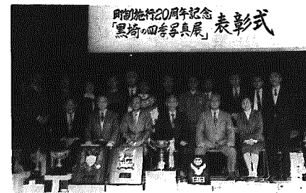
表彰式後の記念撮影