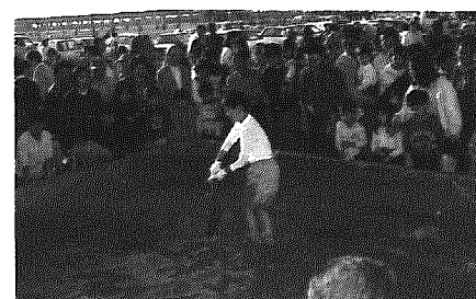
鮭をガッチリつかまえる。

午後二時三十分から、改善センター講堂での抽選会であった方に鮭のつかみどりが行われました。鮭は信濃川漁協のご協力で五十三尾用意されました。特設の「いけす」に入って鮭をつかまえました。四苦八苦しながらも見事つかまえるとまわりから歓声が上がっていました。