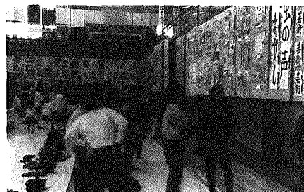
盆栽・図画・習字など展示

文化祭前日の準備のようす。総合体育館2階の通路では、毎年消防展の作品が展示されていますが、アーチの花のかざりつけが行われていました。