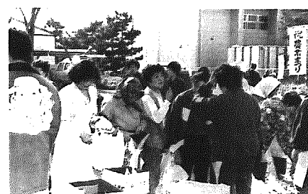
新鮮な野菜ばかりの野菜市は盛況でした。

環境改善センターでは、三日の午前九時から野菜市が行われました。これは、キャベツ、大根、白菜などの新鮮な野菜を格安な値段で提供するもので、特にまるまると大きな里芋などは始まって十分で売り切れるほどでした。どの野菜も売れゆきはよく、午前中に完売となりました。