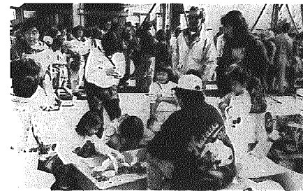
金魚すくいコーナー

綿アメ、金魚すくい、焼きソバなどの縁日コーナーは午前九時三十分から始まりました。今年も例年どおり大人気で、特に金魚すくいは小さい子供に好評で、人垣ができていました。