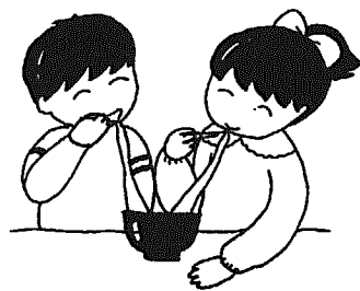
バザーでは、すしやダンゴが売られる