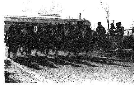
近郷中学校駅伝大会のスタート