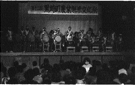
五穀豊穡を祝った太鼓や踊りが披露された。