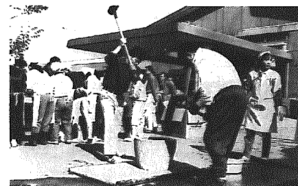
力いっぱいペタンペタン

午前十時三十分からは、もちつきが行われました。むしたもち米を杵でペタンペタンとつきました。ついたものは、きなこ・アンコロもちにししましたが、それをもらおうとスラリ行列ができていました。