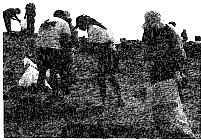
外国人が主催したボランティア活動

いで、ゴミを種類別にカードに記入して拾いました。このカードは世界共通で、後で分析され世界各地の企業や行政に提言するそうです。それにしてもゴミが多く外国の方々をはじめびっくりしていました。