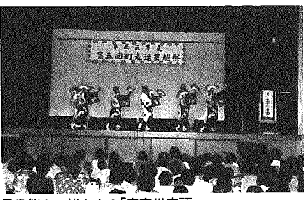
黒鳥第2の皆さんの「真室川音頭」