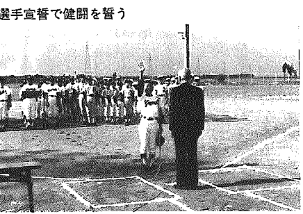
選手宣誓で健闘を誓う