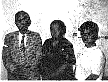
柳作健友会 の皆さん