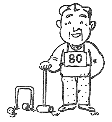
適度の運動を心がけましょう。